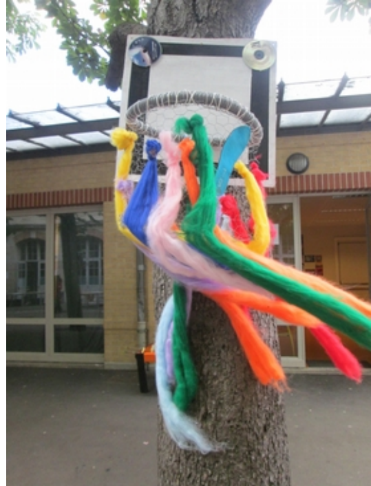
Panneaux de Basket installation techniques mixtes