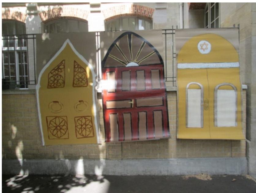
Les trois portes Peinture sur carton