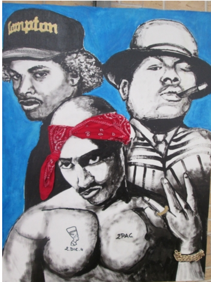
2PAC peinture sur bois , tissu , bijoux